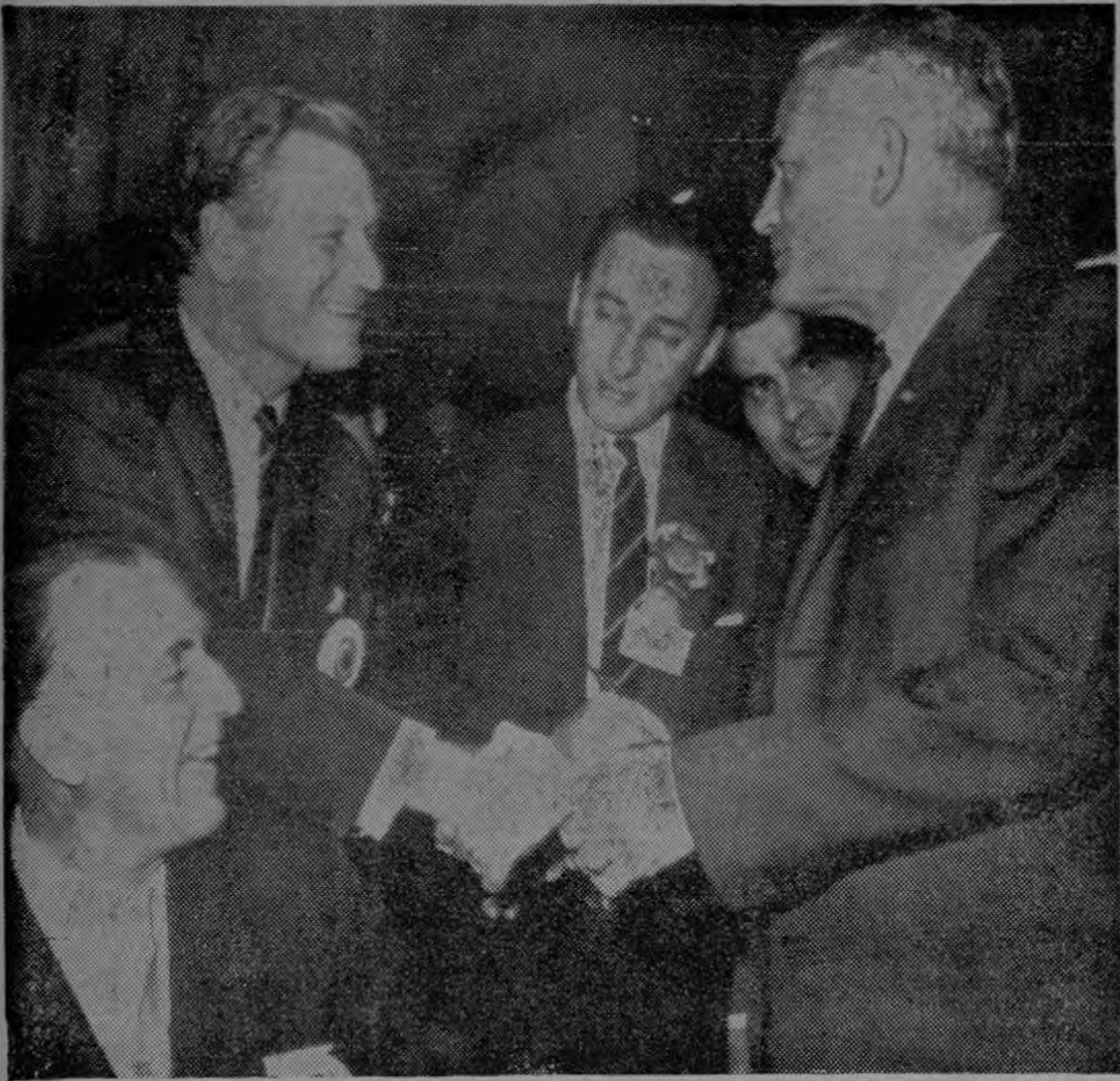
CLEVELAND, Junio 9,.— El Gobernador de Nueva York, Nelson Rockefeller, y el senador de Arizona, Barry Goldwater, cambian un apretón de manos durante la sesión de la Conferencia de Gobernadores en Cle