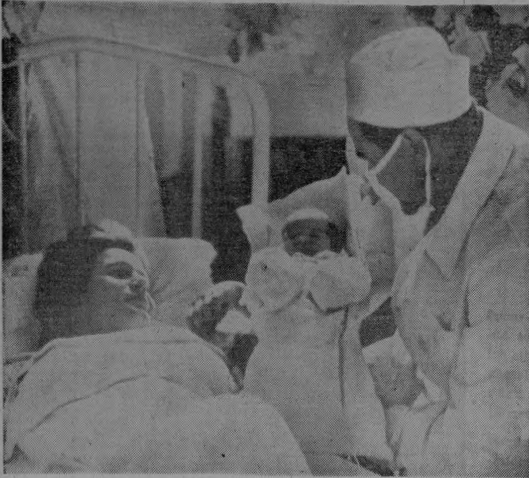
MOSCU, Junio 11. (AP). — El cosmonauta soviético Andrián Nikolayev es visto con su hijita mientras visita a su esposa hoy en una clínica de Moscú. La madre, Valentina Tereshkova, la única cos-