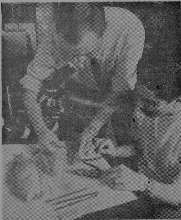
La investigación aplicada de los recursos del mar hace que se obtengan beneficios económicos inmediatos y que de estos se deriven nuevas posibilidades de desarrollo de las entidades costeras de Latinoamérica.

Con el propósito de formar profesionistas especializados que apliquen sus conocimientos a la explotación correcta y ópti-