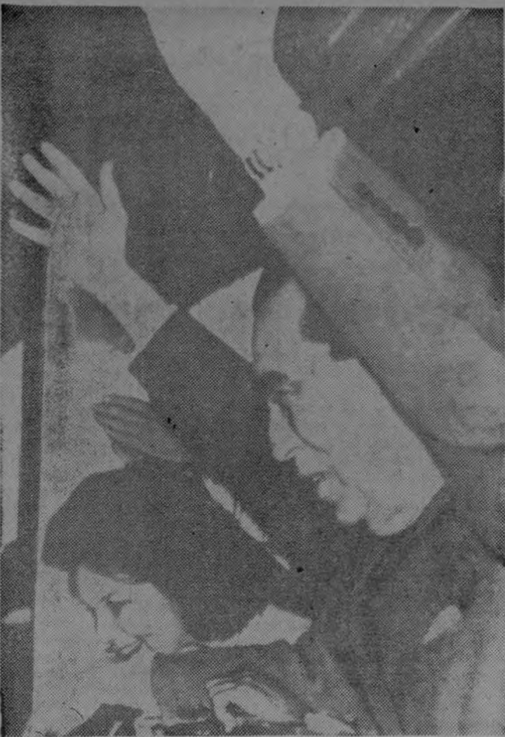
RIO DE JANEIRO, 9, (AP).— El ex presidente Juscelino Kubitschek saluda a millares de partidarios congregados frente a su residencia en Río anoche después de ser suspendido de su banca senatorial y dejado sin derechos políticos por 10 años.