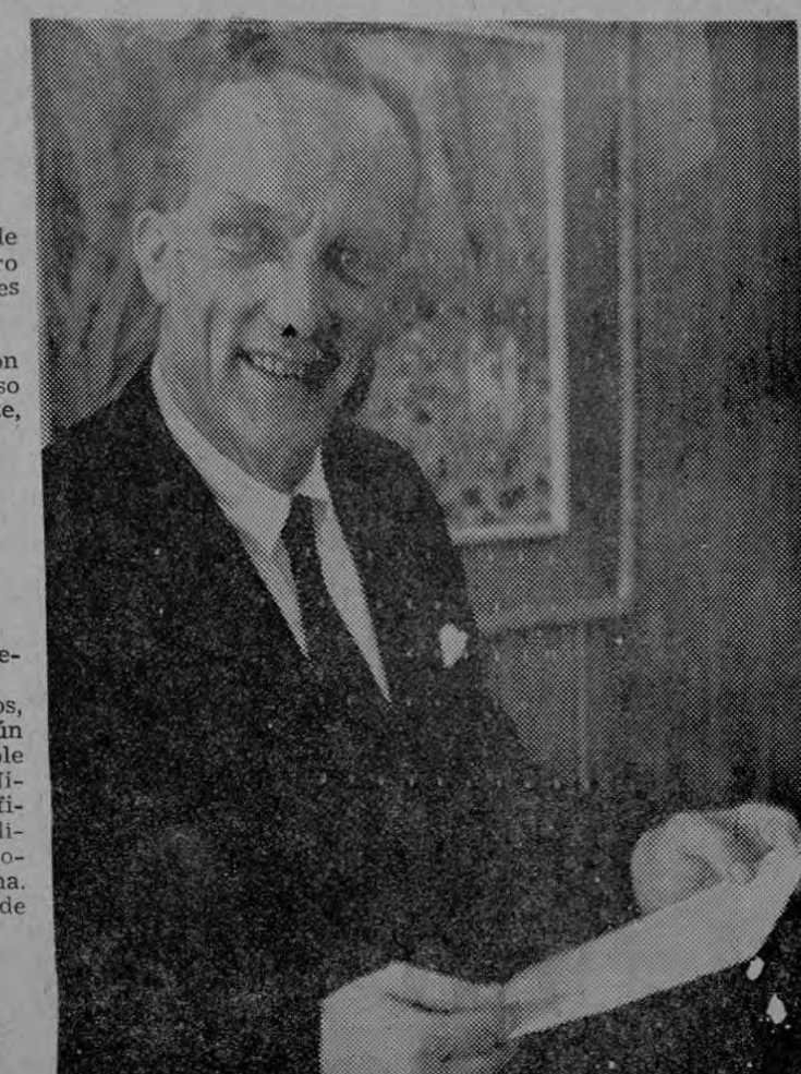
WASHINGTON, 11 (AP). Thomas C. Mann, administrador de la Alianza para el Progreso, aparece en su despacho. Mann dice que los países latinoamericanos necesitan más tiempo para materializar sus reformas económicas y sociales.

García Sanchiz viajaba frecuentemente a la América Latina y era particularmente bien conocido en la Argentina donde pronunció muchas conferencias.